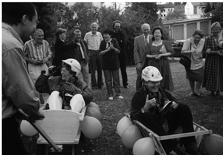
26 SRN, Neugablonz 1998