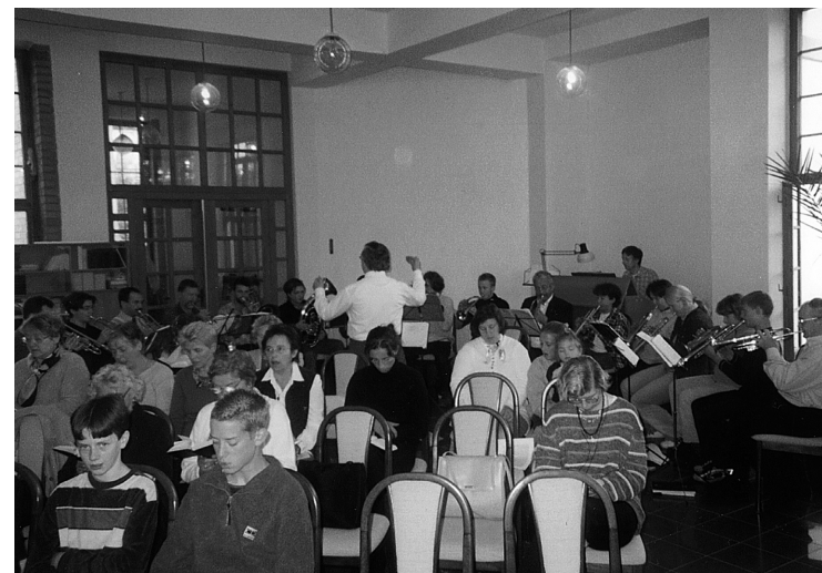
28 Návštěva z Ebersbachu (SRN) 2002