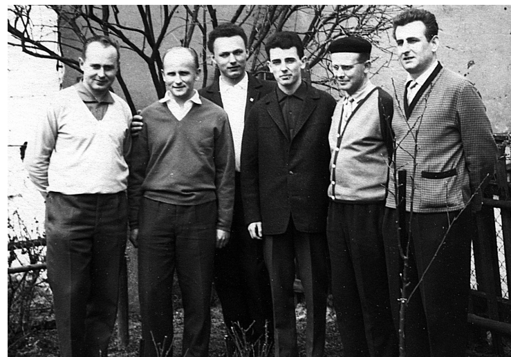
04 Mužský pěvecký sbor