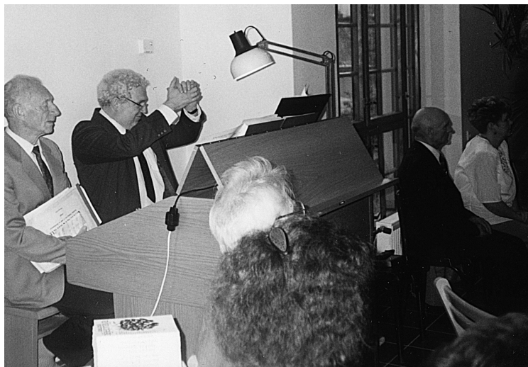
05 Otvírání modlitebny, říjen 1995