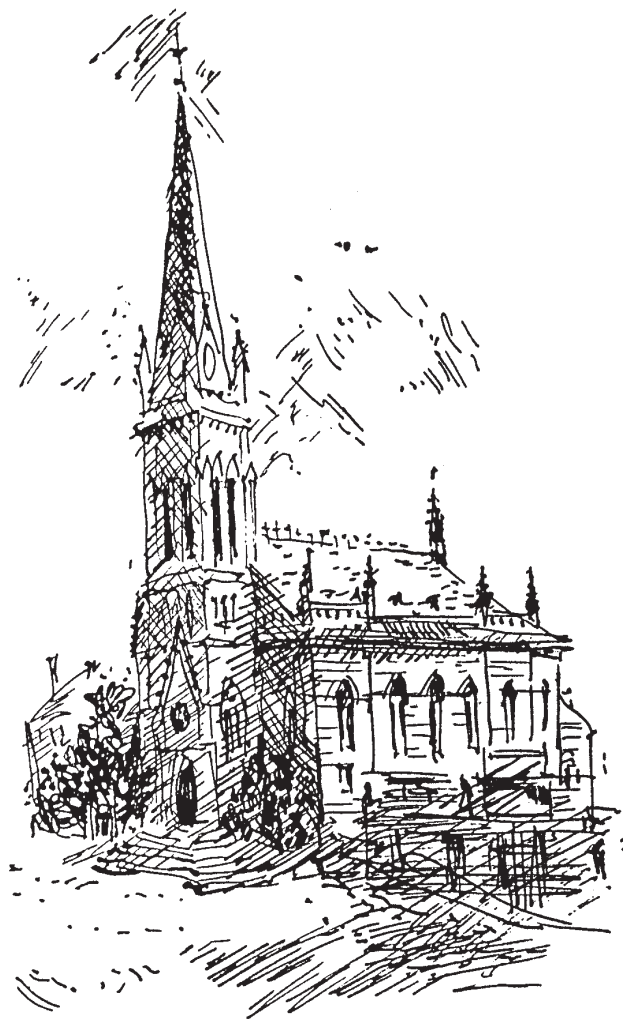
C Původní luteránský evangelický kostel

T ato skupina mladých lidí (od 17 do 30 let) měla velkou chuť zpívat tak, aby je to naplňovalo radostí, a tu pak mohli dávat dál svým zpěvem věřícím na Liberecku, Jablonecku a později po celých Čechách