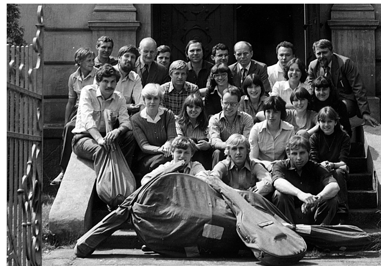
20 Jizeroš 1981, výlet do Žatce