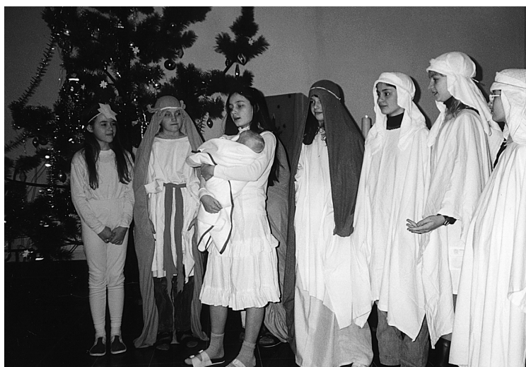
10 Vánoce 2001