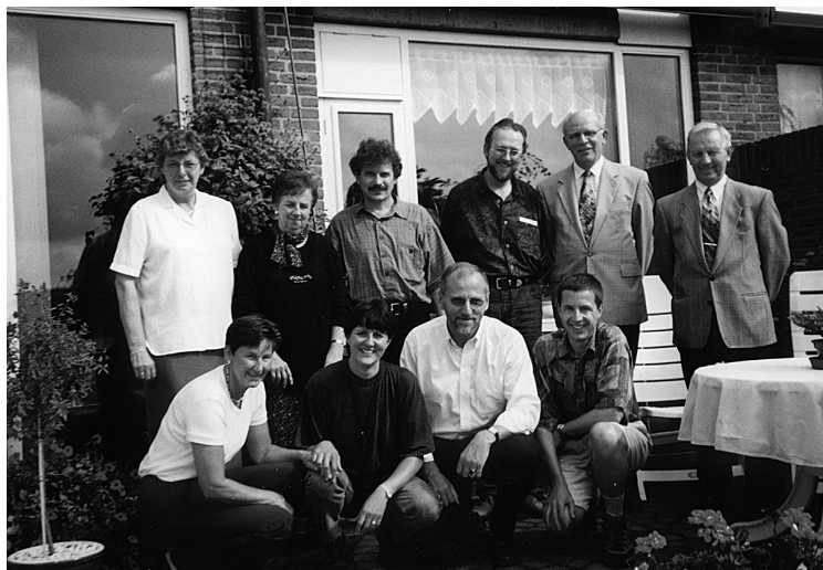
25 Holandsko, s'Gravenzande 2001