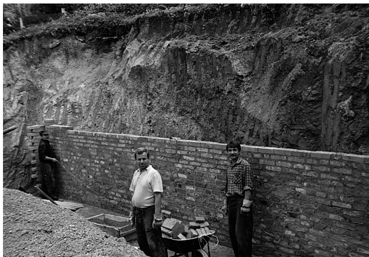
30 Základy modlitebny