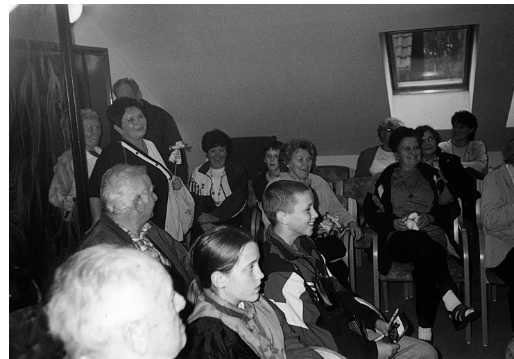
15 Výlet do Krabčic