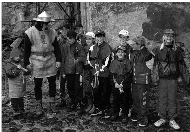
17 „Husité“ na Grabštejně