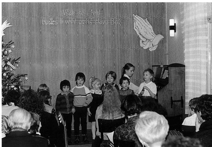
09 Vánoce ve staré modlitebně na faře ČČSH