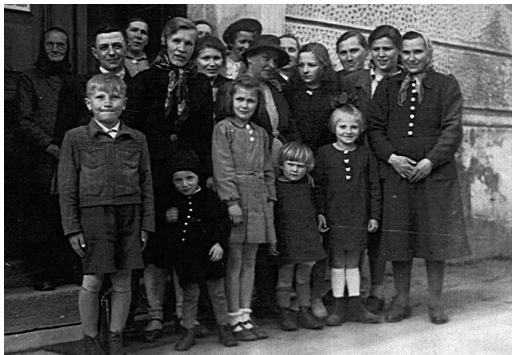
01 Sbor v Hraničné r. 1949