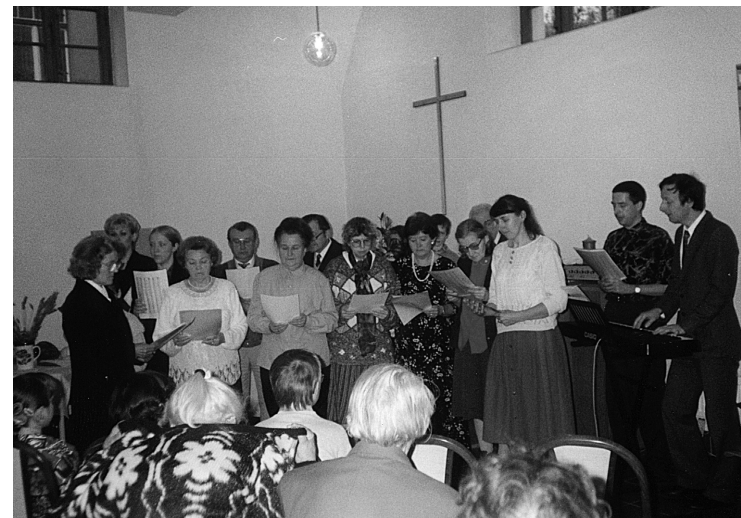
23 Pěvecký sbor