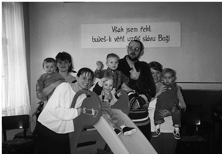
21 Maminky a tatínkové na mateřské dovolené