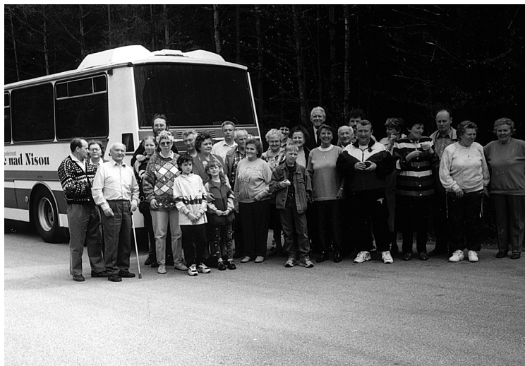
13 Výlet do Göppingen, duben 1998