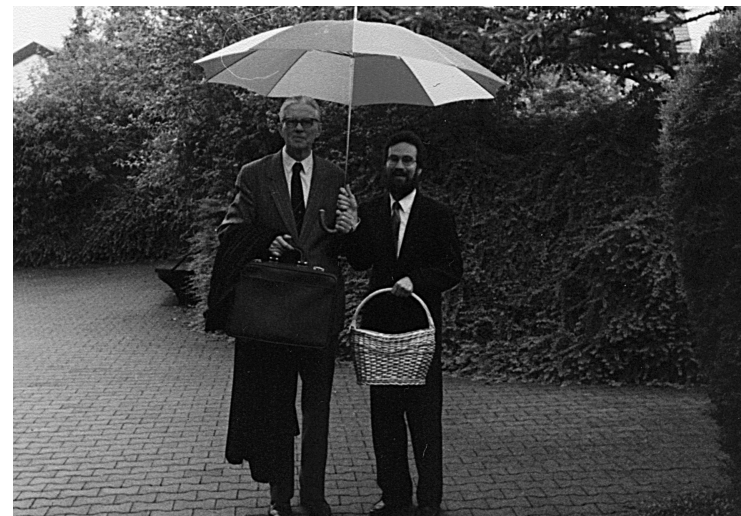
27 SRN, Göppingen, říjen 1994