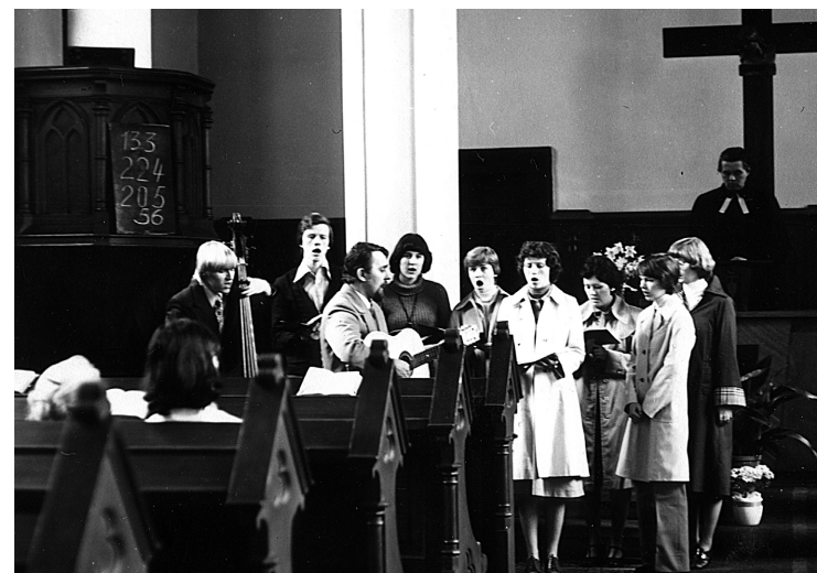
19 Mládež v kostele dr. Farského