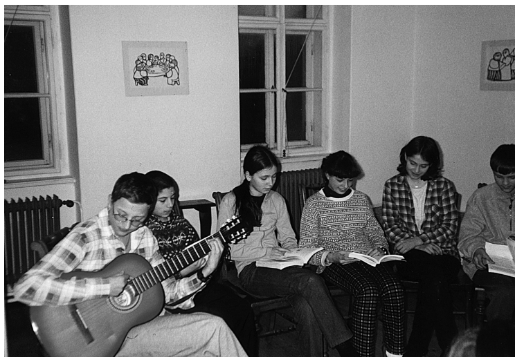
18 Rumburk, březen 2002, sejtí mládeže, Fara ČCE