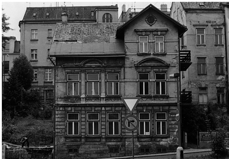
29 Původní stav s demolicí garáže (vlevo)