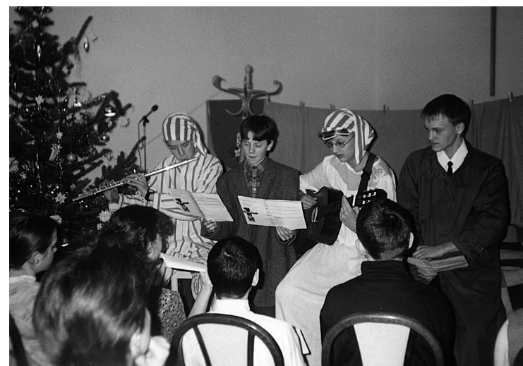
12 Vánoce 2002