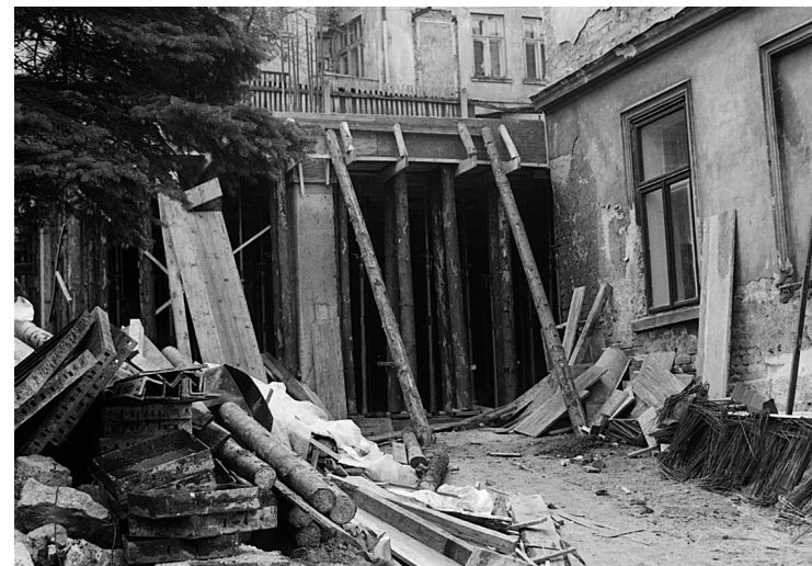
31 Železobetonový skelet 1. nadzemního podlaží modlitebny